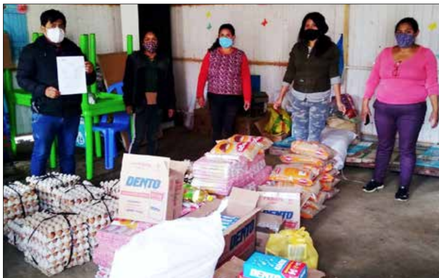
Viele Einwohner ohne Arbeit könnten ohne die Lebensmittelhilfe nicht überleben.

„Der 15. März war ein wunderschöner Morgen. Wie üblich stand ich mit großer Freude auf, um mit meiner Familie zu frühstücken, bis meine Mutter mir mitteilte, dass das Virus, das China angriff, auch in Lima angekommen war. Ich verstand nicht, was dieses Virus war, und am selben Tag hatte ich Angst, als mein Onkel meinen Eltern sagte, dass es einen Lockdown geben würde und niemand das