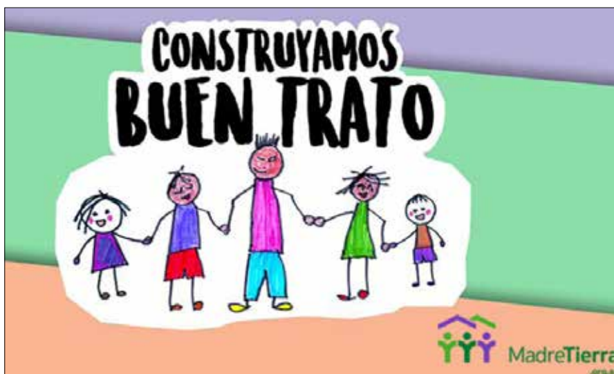
Die Kampagne „Construyamos Buen Trato“ hat als Ziel, die zwischenmenschlichen Beziehungen zu überdenken und zu einem besseren Zusammenleben beizutragen.

Dieses Unterfangen, nämlich den Hunger von Tausenden und Abertausenden von Menschen zu stillen, machen erst die Frauen der Stadtviertel möglich. Sie bereiten Mittag- und Abendessen sowie Snacks für ihre Nachbarn zu und achten dabei besonders auf Kinder, Jugendliche und ältere Menschen. Die NNAs beteiligen sich an diesen Aktivitäten und versuchen ihrerseits, das Wissen ihrer Vorfahren wieder zurückzugewinnen und so mehr Ernährungssouveränität zu erlangen. Die Frauen der Organisationen haben sich auch um die von Covid-19 betroffenen Familien gekümmert und ihnen Lebensmittel