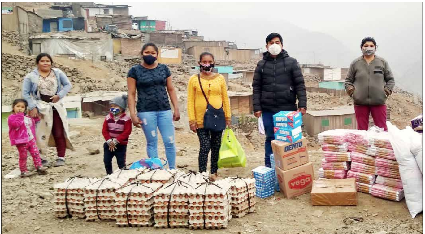
Dank der Nachbarschaftshilfe können in Carabayllo die Ärmsten der Armen mit dem Nötigsten versorgt werden.

Das Projekt führt auch virtuelle Aktivitäten mit Kindern und Jugendlichen durch, um Fähigkeiten zur Selbstpflege durch den pädagogischen Leitfaden „ Ich kenne mich, ich liebe mich, ich kümmere mich um mich “ zu entwickeln. Diese Fähigkeit ist in der Entstehungszeit transzendent, und das Projekt hat Hefte verteilt, damit die Kinder dieses Thema mit ihrem Promotor behandeln können. Eine weitere Aktivität der Interaktion mit den Kindern war die Nachhilfe, die es ihnen ermöglicht, die von den Bildungseinrichtungen entwickelten Kurse besser zu verstehen und zu assimilieren. Auch gelang es den Lehrern während der Projektaktivitäten, Kinder und Jugendliche wieder in das Schulsystem zu integrieren. Sie hatten die Schule abgebrochen wegen Apathie, der schlechten Internet-