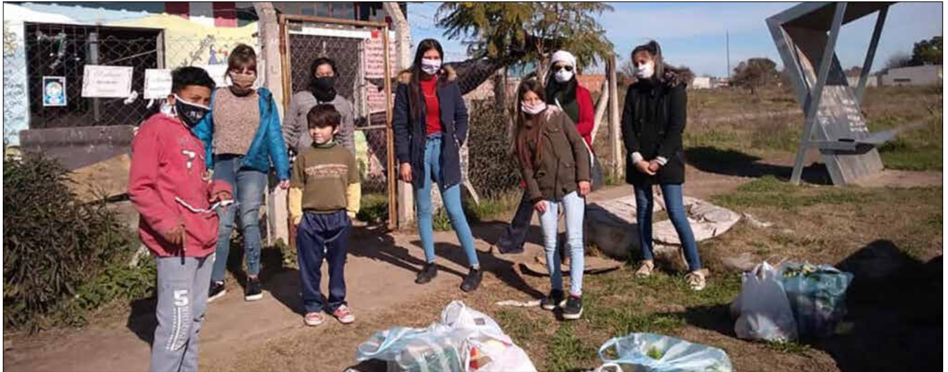
Der Jugendrat im Stadtviertel Los Hornos in Moreno erhält Nahrungsmittelhilfe von Madre Tierra.

und Hygieneprodukte gebracht. In vielerlei Hinsicht erreichen die NNAs in den Vierteln ihr Recht auf Nahrung durch die Organisation und Solidarität einer sensiblen Gemeinschaft, die die Hoffnung auf eine bessere Zukunft mit Gesundheit und Gerechtigkeit für alle aufrechterhält.