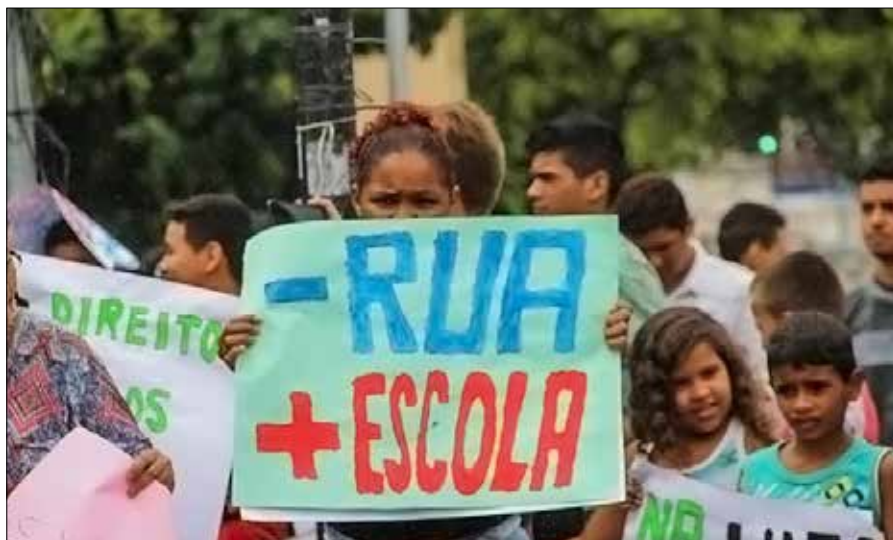
Das Nazareno-Projekt sorgt auch dafür, dass die Kinder nicht auf der Straße arbeiten müssen und stattdessen die Schule besuchen können.

Drei frühere Mitarbeiter sind an Covid-19 gestorben: Amélia, die sich um ihre an Covid-19 erkrankte Mutter kümmerte und noch vor ihr starb, und Valpeter, der sein ganzes Leben