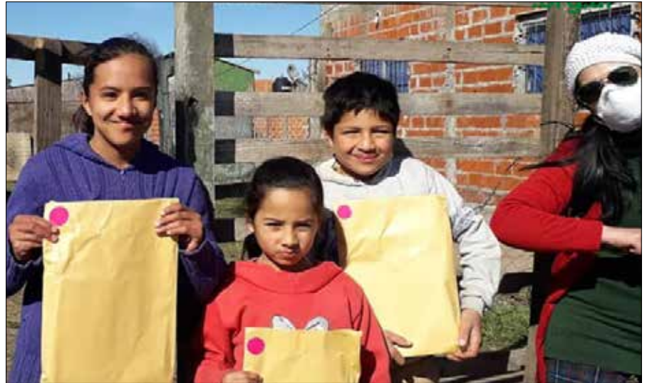
Didaktische Spiele für die Kinder des Kinderrates von El Milenio im Bezirk Moreno.

Außerdem wurde ein Notfallhilfeprogramm für Arbeit und Produktion eingeführt, um die formelle Beschäftigung und Unternehmen zu unterstützen, den Sozialschutz auszuweiten und mehr Menschen zu erreichen. Andere Hilfsmaßnahmen wurden verstärkt, wie z.B. die allgemeine Kinderzulage. Die Lebensmittelkarte für den Kauf von frischen Lebensmitteln wurde eingeführt. Diese Transferpolitik wurde durch andere Maßnahmen ergänzt, die sich ebenfalls auf das Haushaltseinkommen und den Zugang zu Gütern und Dienstleistungen auswirken. Beson-