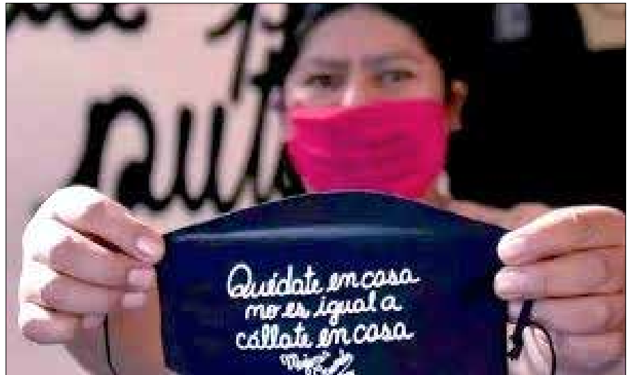
„Zu Hause bleiben ist nicht dasselbe wie zu Hause eingesperrt sein“

Einer der Hauptgründe für diese Situation ist die systematische Aufgabe der öffentlichen Dienstleistungen seit den 1990er-Jahren. Zudem machte die Regierung einen strategi-