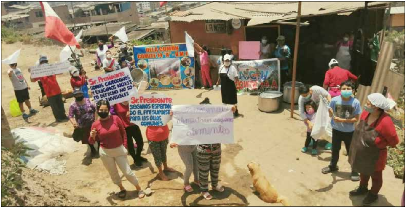
Die Einwohner des Elendsviertels haben viele Forderungen an ihren Bürgermeister und ihren Präsidenten.

Haus verlassen könnte. Und er hatte Recht, von diesem Tag an gingen meine Brüder und ich nicht mehr aus. Wir bekamen online Schulunterricht und wir machten die Hausaufgaben mit Unterstützung unserer Mutter.