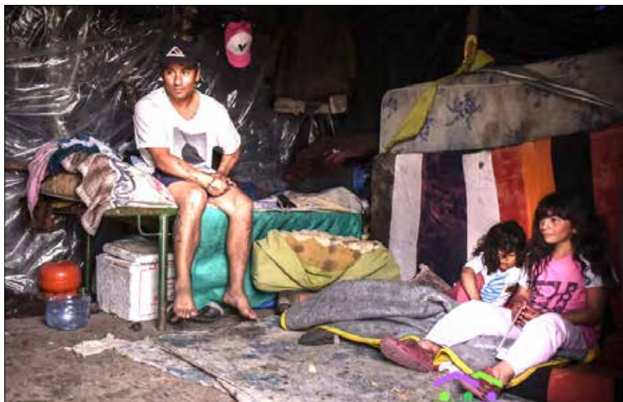
In den beengten Hütten der Elendsviertel findet Corona ideale Bedingungen vor.

Die neoliberale Politik hat aber nicht nur im Gesundheitswesen Verwüstungen angerichtet; die Wirt-