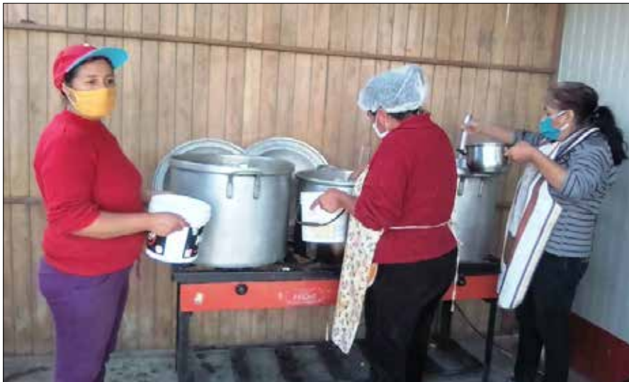
Im Großraum Lima gibt es immer noch mehr als 700 Volkskantinen.

haben die Regeln zur Eindämmung des Infektionsgeschehens ignoriert. Sie haben ihre Wohnungen verlassen und verzweifelt versucht, sich auf den Märkten Grundnahrungsmittel zu beschaffen. Sie gelten demnach als die wichtigsten Infektionsherde. In dieser Situation sind aus der Bevölkerung spontane Initiativen entstanden, die von Solidarität und kollektiver Arbeit getragen werden, wie z.B. die „Volkskantinen“ oder „Kantinen gegen den Hunger“, von denen es im Großraum Lima immer noch mehr als 700 gibt.