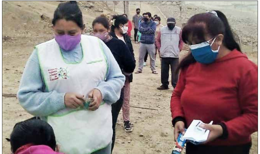
Neben Nahrungsmitteln werden Schulmaterial, Hygienesets und Masken verteilt.

Der Lockdown war und ist nicht einfach weder für die Erwachsenen