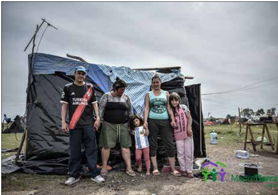
Die Ansiedlungen, die im Zusammenhang mit der Pandemie stattfanden, haben das weit verbreitete Problem des Zugangs zu Land und Wohnraum in Argentinien auf die Tagesordnung gesetzt. Madre Tierra sieht dies als eine Chance für die Gesellschaft, das Leid, das die Schwächsten durchmachen, wieder gutzumachen.