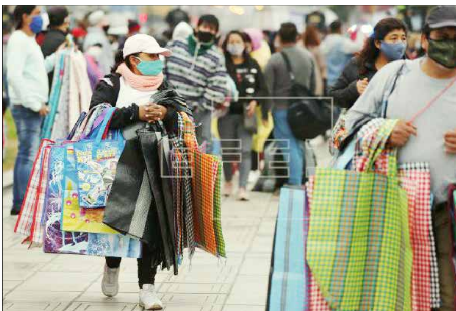
Nur die Straße sichert ein Einkommen und somit das Überleben.

Diese Menschen, die keine oder nur minimale Unterstützung erhielten,