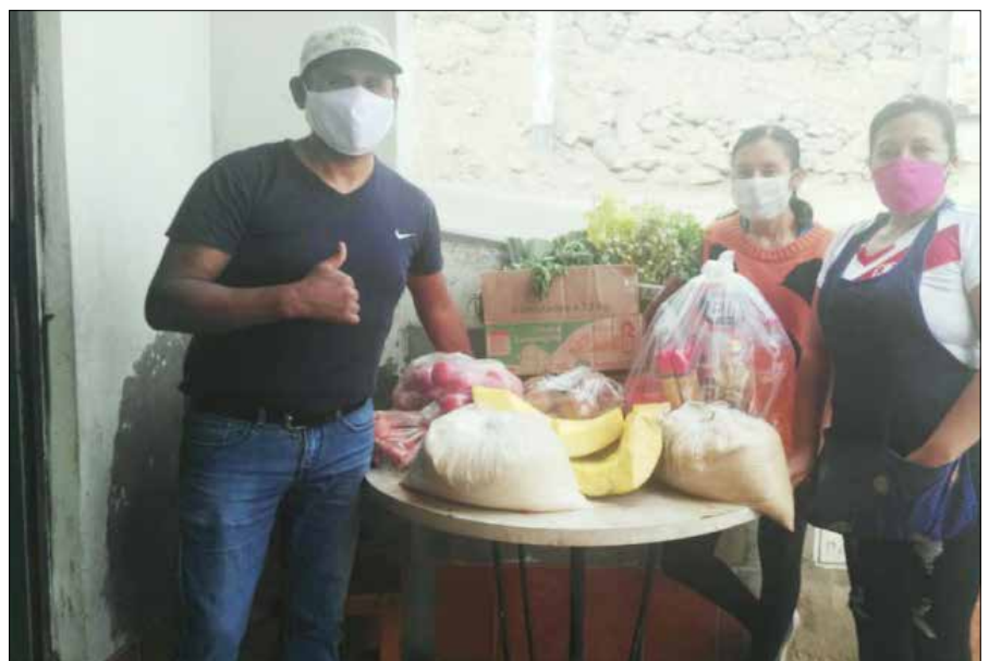
Die gespendeten Lebensmittel stellen eine willkommene Hilfe dar.