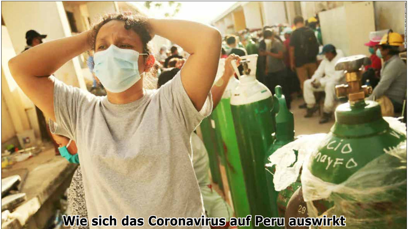
Wie sich das Coronavirus auf Peru auswirkt