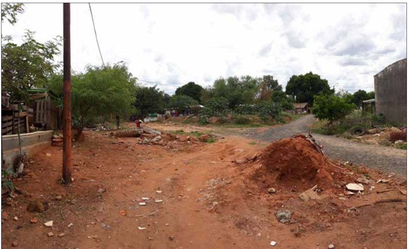
Der Spielplatz vor der Schule von Cerro Poty - und drum herum .....

Die Familien leben immer noch von der Hand in den Mund, weiterhin