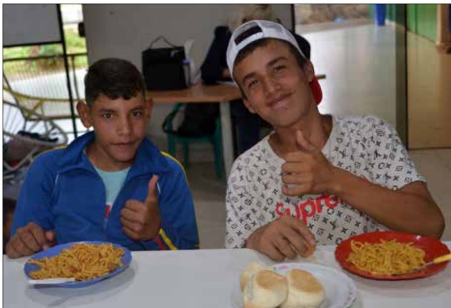
Diesen zwei Jugendlichen schmeckt es ganz offensichtlich im CAI.

Kinderschutz bedeutet nicht nur, den Kindern eine warme Mahlzeit zu geben, und noch viel weniger geeignet sind repressive Massnahmen. So wurden die Kinder früher oft auf der Straße aufgegrif-