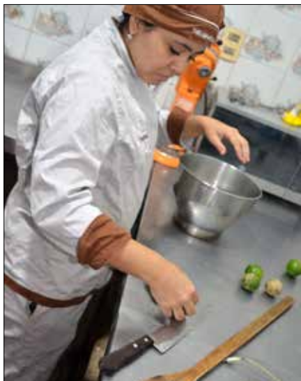
In dieser Bäckerei, die dem Hauptsitz von Callescuola angegliedert ist, lernen Jugendliche das Bäckerhandwerk. Die hergestellten Produkte werden an die umliegenden Gemeindeverwaltungen verkauft.