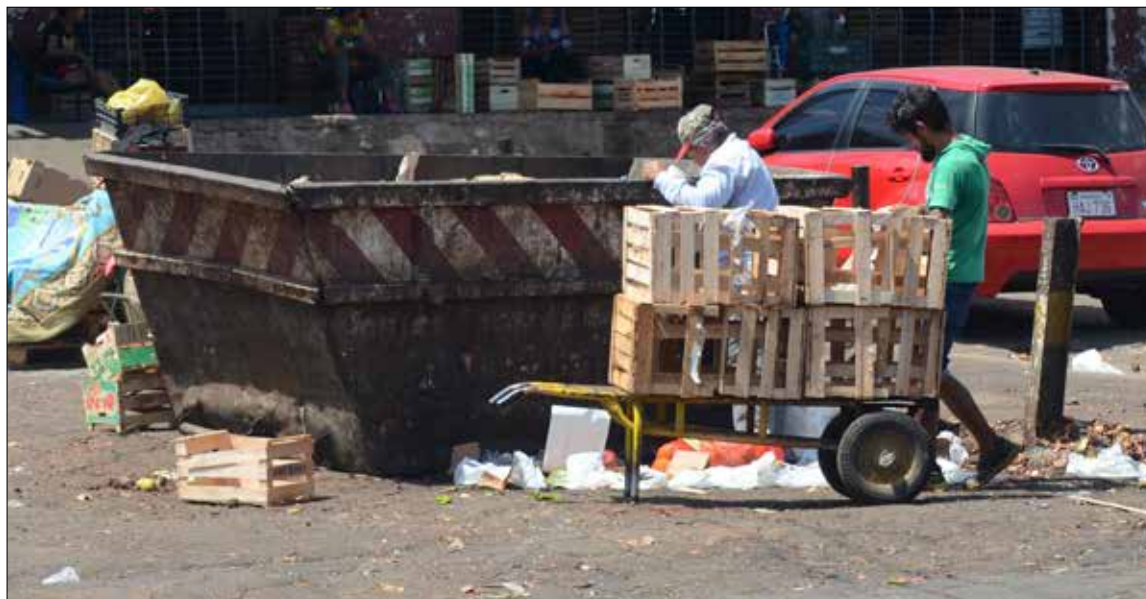
Leben und Überleben auf dem „Mercado de Abasto“ in der Hauptstadt Asunción (Foto oben).