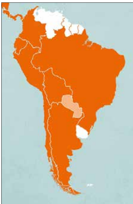
Paraguay ist ein Binnenstaat und liegt zwischen den Ländern Brasilien, Argentinien und Bolivien.