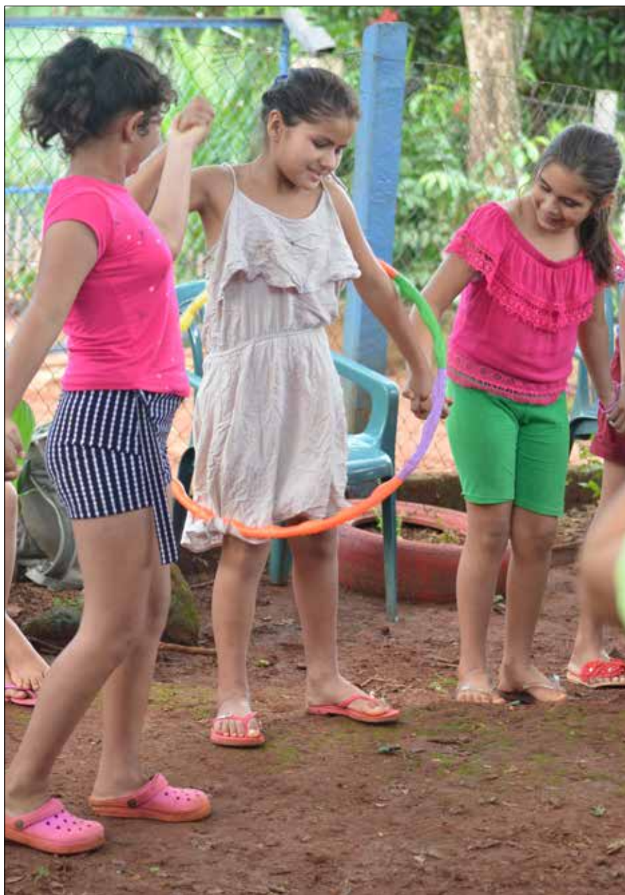
Auch Freizeitaktivitäten gehören zum Konzept von „Callescuela“.

fen und in Heime gesteckt. Doch diese Vorgehensweise hat sich als absolut kontraproduktiv erwiesen, denn die Arbeit eines Kindes hilft oftmals das Überleben seiner Familie zu sichern.