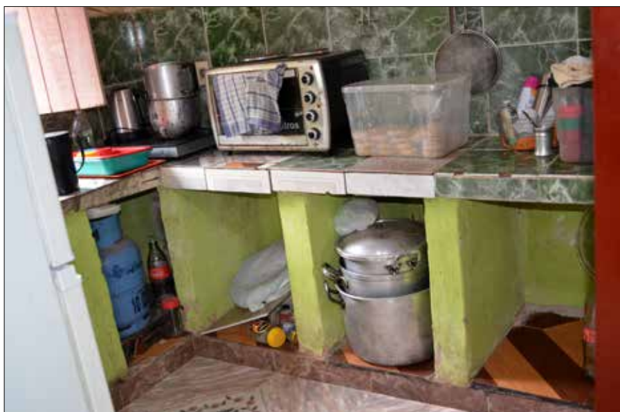
Die Menschen in der Siedlung Villa Elisa in Asunción versuchen, das Beste aus ihren widrigen Lebensumständen zu machen (Foto links).