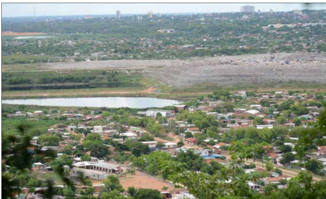
Eine Müllhalde trennt die Hauptstadt Asunción und das Viertel Lambaré (Foto unten).