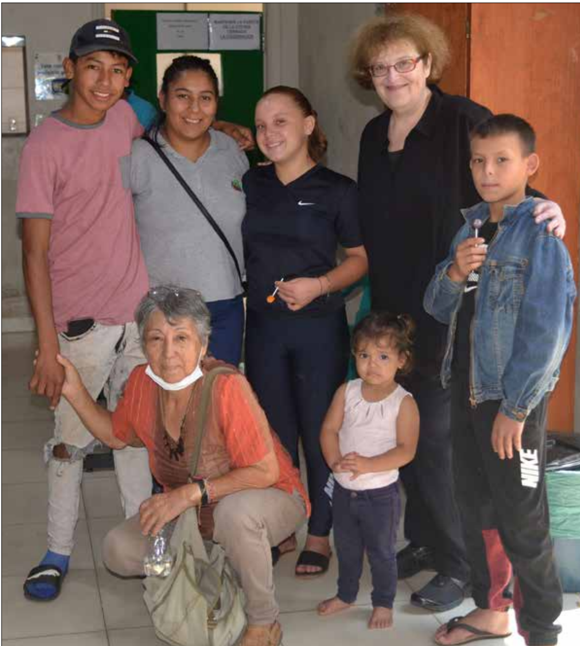
Kinder im CAI mit einer der Gründerinnen von „Callescuola“ (knieend) und unserer Mitarbeiterin.

Deshalbkämpft „Callescuola“ in erster Linie nicht gegen Kinderarbeit an sich, sondern vor allem für den Schutz vor ausbeuterischen Arbeitsbedingungen. Um dies zu erreichen, ist es auch wichtig, dass die Jugendlichen lernen, sich selbst zu organisieren. Dieses von NPNP unterstützte Projekt