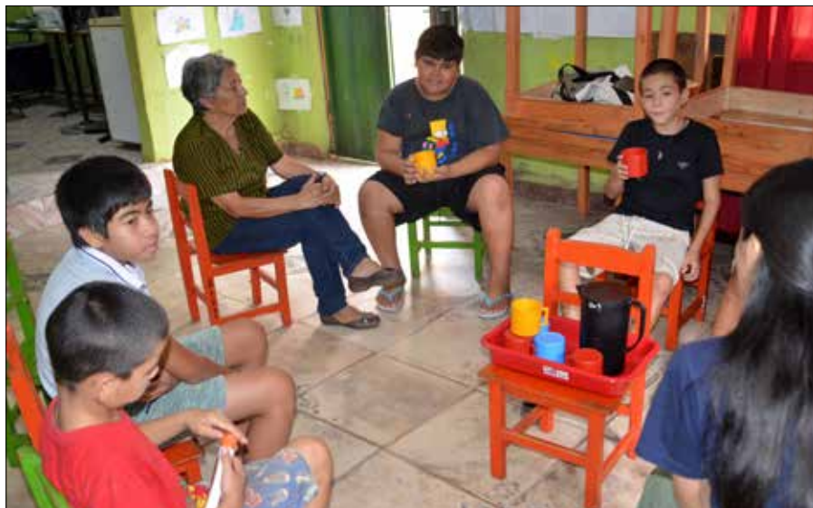
In den Siedlungen Villa Elisa und Presidente Franco werden die Kinder - je nach Schulbesuch vormittags oder nachmittags - in Gruppen betreut und lernen spielerisch u.a. auch soziales Verhalten.