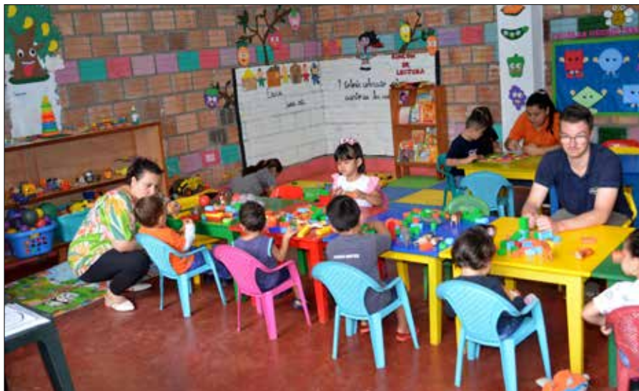
Den Namen Añua Roga (Añua bedeutet soviel wie Umarmung) haben die Kinder in Ciudad del Este gewählt, weil das Gebäude sich wie zwei Arme in Richtung der Siedlung öffnet (Fotos oben und Mitte rechts).