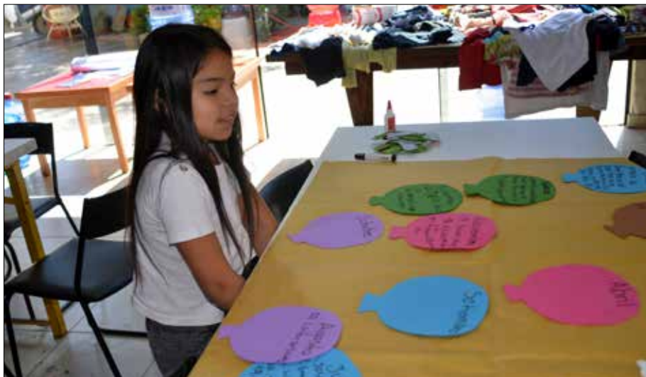
Im „Centro de atención integral“ (CAI) werden die Kinder betreut, die entweder selbst auf dem Markt arbeiten, oder deren Mütter dort morgens arbeiten bzw. nachmittags einer Weiterbildung nachgehen.